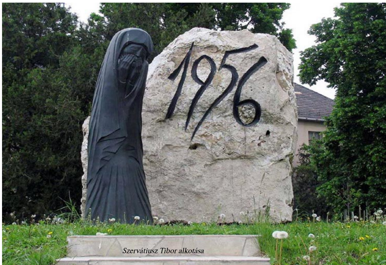
Szervátiusz Tibor alkotása