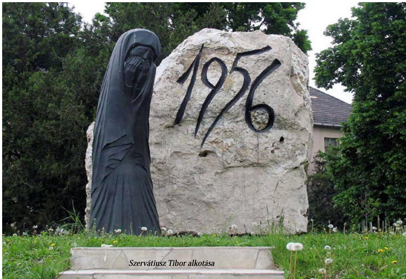
Szervátiusz Tibor alkotása